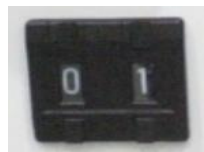
当該スイッチの写真