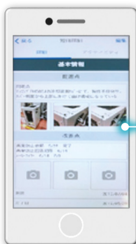
スマホで入力 写真も添付