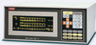
外置 标准尺寸放大器