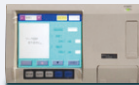
外置标准尺寸放大器